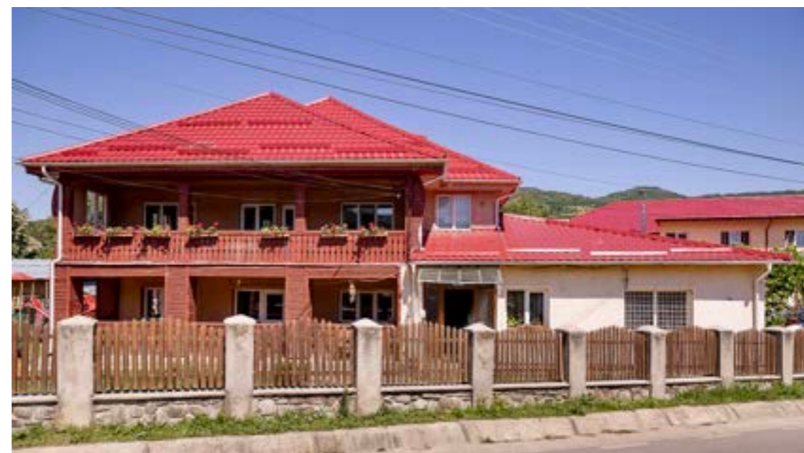
Vorderansicht vom Kinderheim Amurtel Familie

Gesuch Die Sicherstellung der laufenden Kosten von Kinderheim, Wohnstätte für beeinträchtigte Erwachsene (ehemalige Kinderheimbewohner) und die Wohneinrichtung für die berufliche Integration ist uns ein grosses Anliegen. Wir freuen uns, wenn Sie uns mit Ihrem Beitrag helfen, dass CFH den betreuten Kindern Chancen auf ein selbstständiges Leben nachhaltig garantiert und dem Betreuungspersonal seinen Arbeitsplatz verlässlich zusichert. Sie helfen die Negativspirale von dysfunktionalen Familien zu durchbrechen und schaffen somit eine nachhaltige Veränderung in der rumänischen Gesellschaft in der Region Buzau.