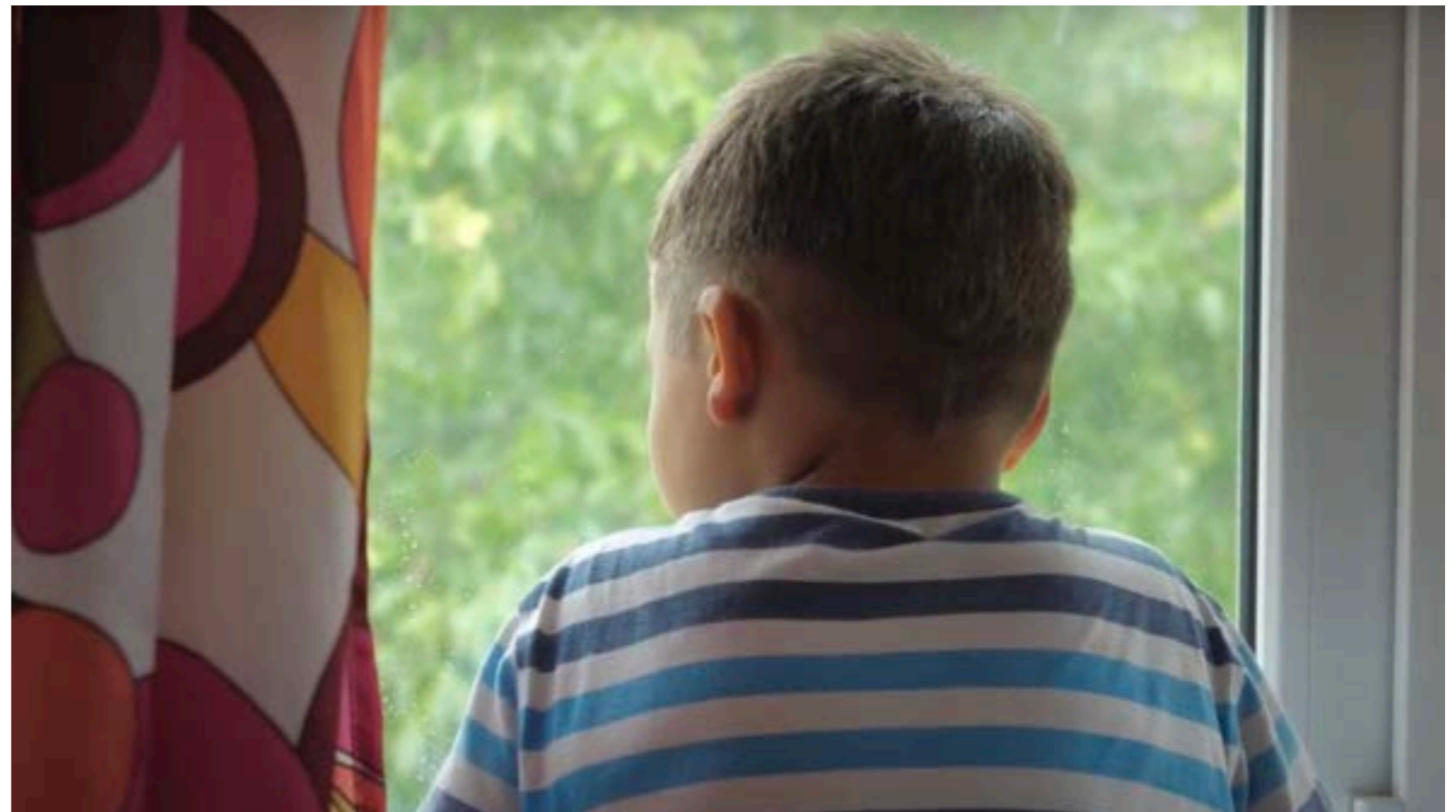
Ein Kind in Amurtel Familie schaut aus dem Fenster.

Armut und Alkoholismus führen zu Vernachlässigung. Trotz der großen Fortschritte, die Rumänien seit dem Fall des Kommunismus 1989 gemacht hat, leben immer noch 46 Prozent aller Kinder in Armut, vor allem in den ländlichen Gebieten. Obwohl Rumänien 2006 der EU beigetreten ist, hinken die ländlichen Gebiete selbst bei der Bereitstellung grundlegender moderner Infrastrukturen wie fließendem Wasser und Toiletten mit Wasserspülung hinterher. Es